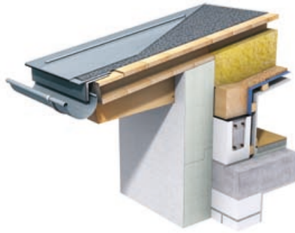
Fig. 1: Ventileret tagkonstruktion med isolering mellem spærene